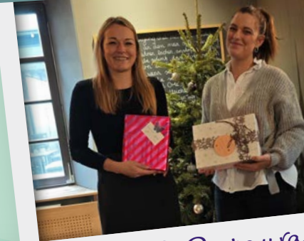
Hotel & Restaurant Steinhaus 1718