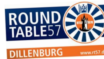
Round Table Dillenburg

Im Namen aller Kinder und Jugendlichen bedanken wir uns von Herzen bei allen Beteiligten für ihre Zeit, ihre Großzügigkeit und ihr offenes Herz. Sie alle haben dazu beigetragen, Hoffnung, Freude und Weihnachtszauber zu schenken.