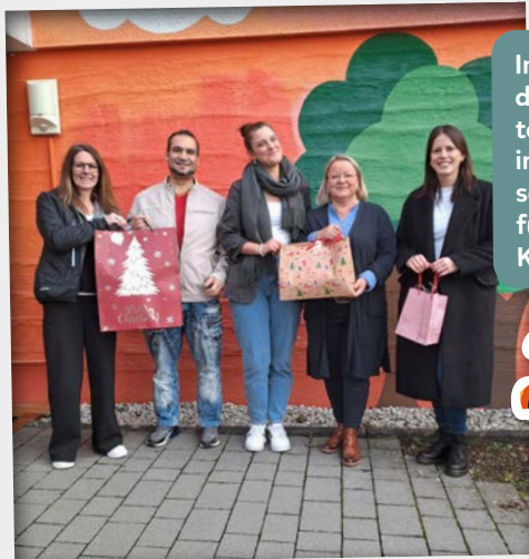
Outokumpu Nirosta GmbH

Im Dezember 2025 sorgte die Belegschaft der Outokumpu Nirosta GmbH in Dillenburg bereits zum sechsten Mal in Folge für leuchtende Augen im Kinderdorf Wetzlar.