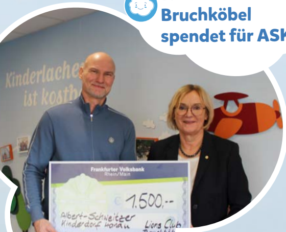
Lions Club Bruchköbel spendet für ASK