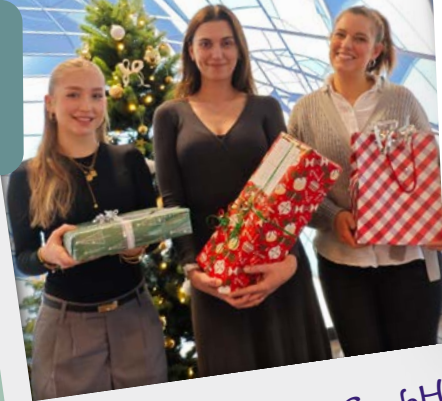
Abbott Medical GmbH

Im Rahmen eines betriebsinternen Weihnachtsbaums erfüllten die Mitarbeiterinnen und Mitarbeiter der Abbott-Niederlassung in Wetzlar zahlreiche Wünsche.