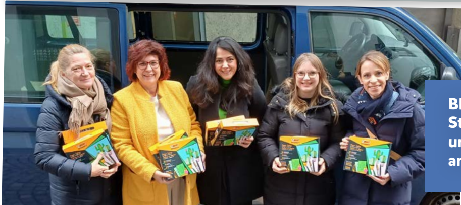
BIC und Sir Peter Ustinov Stiftung spenden Schreib- und Kreativmaterialien an die Kinderdörfer

10 Bildung beginnt oft mit einer guten Idee und manchmal auch mit einem Stift. Das haben die Sir Peter Ustinov Stiftung und BIC Deutschland in die Tat umgesetzt. Sie überreichten dem Albert-Schweitzer-Kinderdorf Hessen e.V. eine umfangreiche Sachspende. Die Kinder und Jugendlichen des Kinderdorfes freuten sich über zahlreiche Stifte, Füllfederhalter sowie Bastel- und Malsets, die künftig in Schule, Kindergarten und im privaten Alltag zum Einsatz kommen.