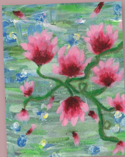
Kinga, 12 Jahre