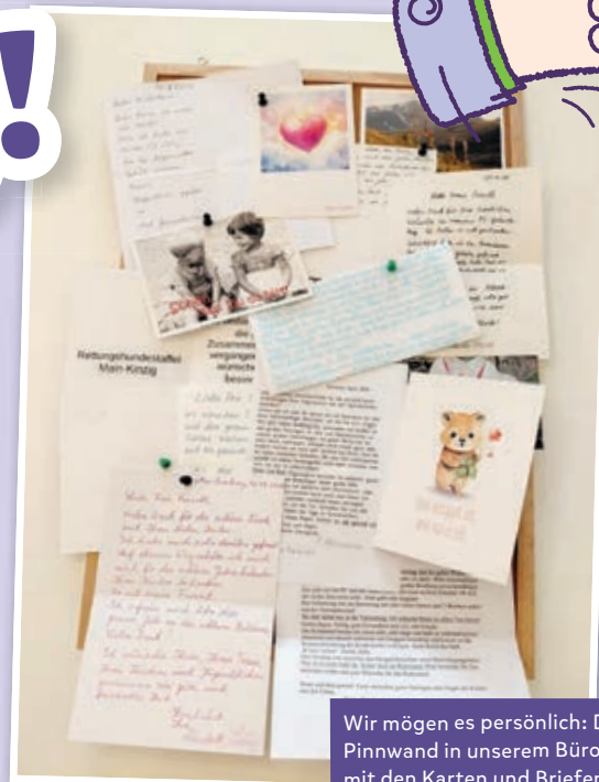
Wir mögen es persönlich: Die Pinnwand in unserem Büro mit den Karten und Briefen unserer Spender

Wo immer möglich, pflegen wir eine persönliche, vertrauensvolle Beziehung zu unseren Partnern. Da Vertrauen